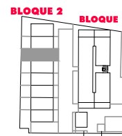
BLOQUE 2. VIVIENDA 6