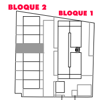
BLOQUE 2. VIVIENDA 5